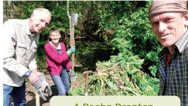
A Rocha Dronten, de jongste lokale groep

Ook is De Parel op 16 april 2021 is een Heuvelrugtuin geworden. Dit is een initiatief om het Nationaal Park Utrechtse Heuvelrug te vergroten en zo de biodiversiteit te bevorderen, door middel van het aanplanten van inheemse planten in tuinen. Aan de rand van de moestuin op De Parel zijn diverse inheemse planten geplant, waarna er samen met IVN een bordje werd geplaatst. Hiermee is de Heuvelrug voorbeeldtuin officieel geopend.