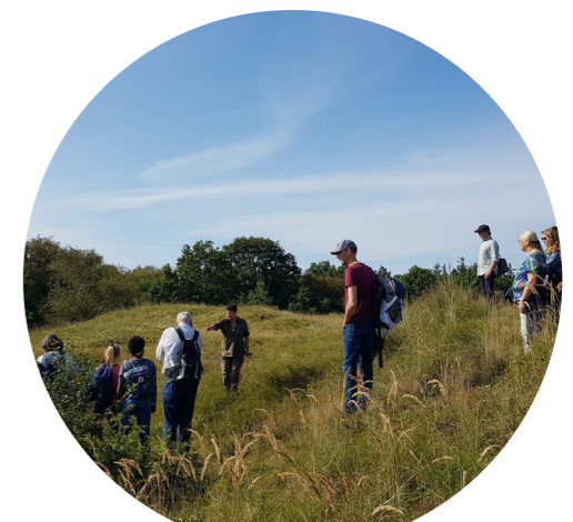
Opruimactie op Schiermonnikoog

Voor A Rocha Noord Nederland betekent de World Cleanup Day in september een schoonmaakactie op Schiermonnikoog. Vanuit Assen gaat de groep vrijwilligers de hele dag aan het werk op het eiland. Zij gebruiken deze dag niet alleen om afval te rapen, maar helpen in samenwerking met Natuurmonumenten ook de duinvalleien open te houden. Door de achteruitgang van het aantal konijnen en de toegenomen hoeveelheid stikstof groeien er te veel bramen en jonge boompjes. Na een dag hard werken kan het gebied weer even vooruit.