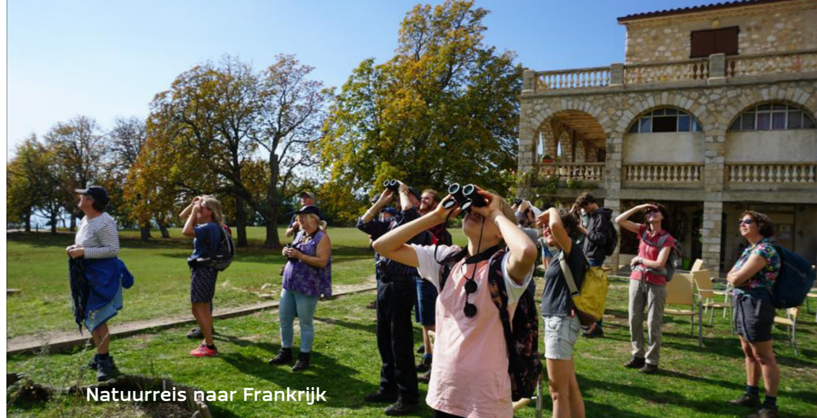
Natuurreis naar Frankrijk